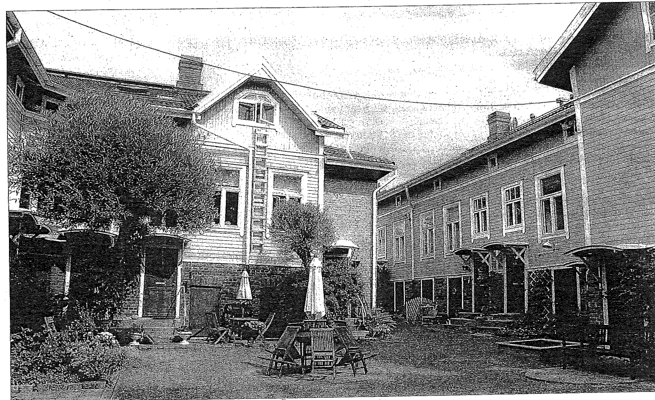
Bevarat. I Port Arthur har man lyckats bevara många fina trähus och mysiga gårdar.

dad tur till fornlämningarna från järnåldern som finns i Hallis. Turen startar kl. 18 vid Hallisforsen (Valkkvarnsgränden 2). På tisdag berättas det historier om hallis i Nummis bibliotek på Töykäläгатan 22 kl. 17.30–20.